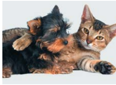
Aspirin ist für Katzen und Hunde giftig

Todesursache in den USA. 15 Weitere erschreckende Zahlen kommen aus Schweden und England: Eine schwedische Studie hat gezeigt, dass jeder 20. hospitalisierte Patient an den Folgen von Medikamentennebenwirkungen stirbt. 16 Eine Untersuchung in England hat ergeben, dass jede 15. Spitaleinweisung aufgrund von Nebenwirkungen von Medikamenten erfolgt. 17