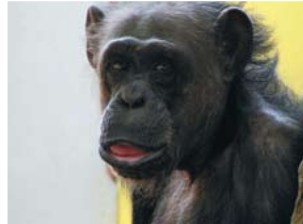
Trotz 97% identischer Gene lassen sich Affen z.B. nicht mit HIV infizieren