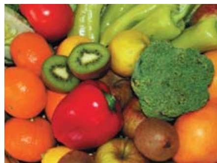
Laut Tierversuch ist alles krebsereizend

Hinlänglich bekannt ist, dass das Antibiotikum Penicillin von Alexander Fleming 1928 entdeckt wurde. Nach der Rückkehr aus dem Urlaub bemerkte er, dass sich in einer mangelhaft abgedeckten Glasschale,