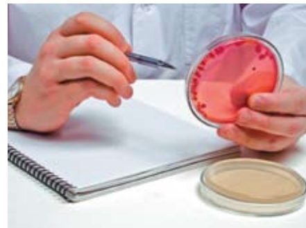
Exakte Forschung ohne Tierleid

dern aufrechtzuerhalten, hat das Nationale Krebsinstitut (National Cancer Institute) sogar bewusst die geringen Fortschritte übertrieben (z.B. fünfjähriges Überleben als Heilung bezeichnet) und statistische