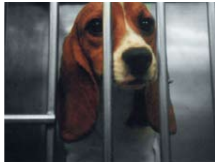
Tierversuche bedeuten immer Leid

Sicher kennen Sie auch den Fall Thalidomid, besser bekannt unter dem Handelsnamen Contergan (wurde 2007 auch verfilmt). Als 1957 das Medikament auf den Markt kam, versandte die Herstellerfirma Grünenthal ca. 40 000 Rundschreiben an Ärzte, Apotheker und andere, in denen es als das beste Mittel für Schwangere und stillende Mütter bezeichnet wurde. Als «wirklich neues Produkt» habe man seine Sicherheit durch ausgedehnte Tierversuche besonders gründlich überprüft! So wurde es zum beliebtesten Schlafmittel. In Deutschland schlief jede dritte Frau abends mit Contergan ein. 8 Drei Jahre nach Markteinführung lagen zahlreiche Meldungen über Fehlbildungen der Arme und Beine bei Kindern von Müttern, die während der Schwangerschaft Contergan eingenommen hatten, vor. Insgesamt wurden etwa 10 000 verstümmelte Kinder geboren. 9 Wie konnte es dazu kommen? Der Mensch reagiert auf