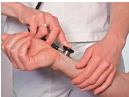
Klinische Forschung ist der sicherste Weg

Diese lange Auflistung stellt nur einen sehr kurzen Ausschnitt der Fortschritte dar, die