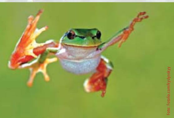
«Wow, ich kann fliegen»